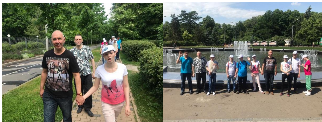
Рис. 8 Совместная прогулка выпускников и взрослых товарищей в парке Сокольники

30 мая, пока высокие гости знакомилась с проектом «Мягкий переход» сами ребята отправились на прогулку в парк Сокольники, Полина Б. уже нашла там взрослого друга.