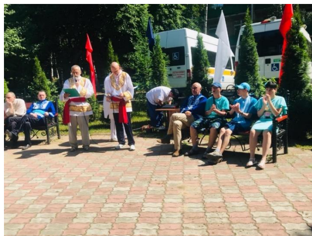
Рис.9. Выпускники в гостях в ПНИ 23

19 июня большой компанией ребята и взрослые погуляли в парке Сокольники: размялись, пообщались, нашли общие интересы.