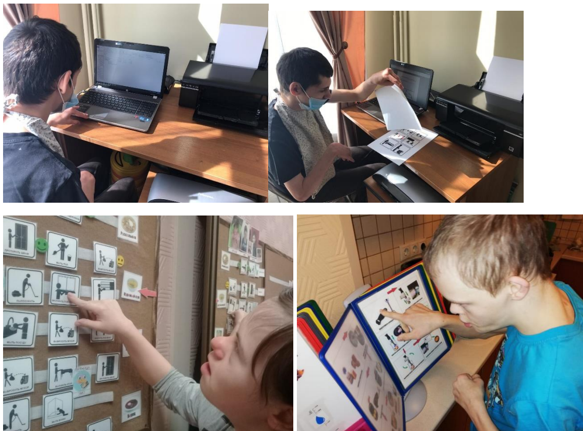
Рис.16 Изготовление и использование визуальных инструкций и визуальных помощников.

В АдаптСтудии 2.0 была оборудована рабочая зона, где выпускники изготавливали необходимые им визуальные помощники и инструкции.