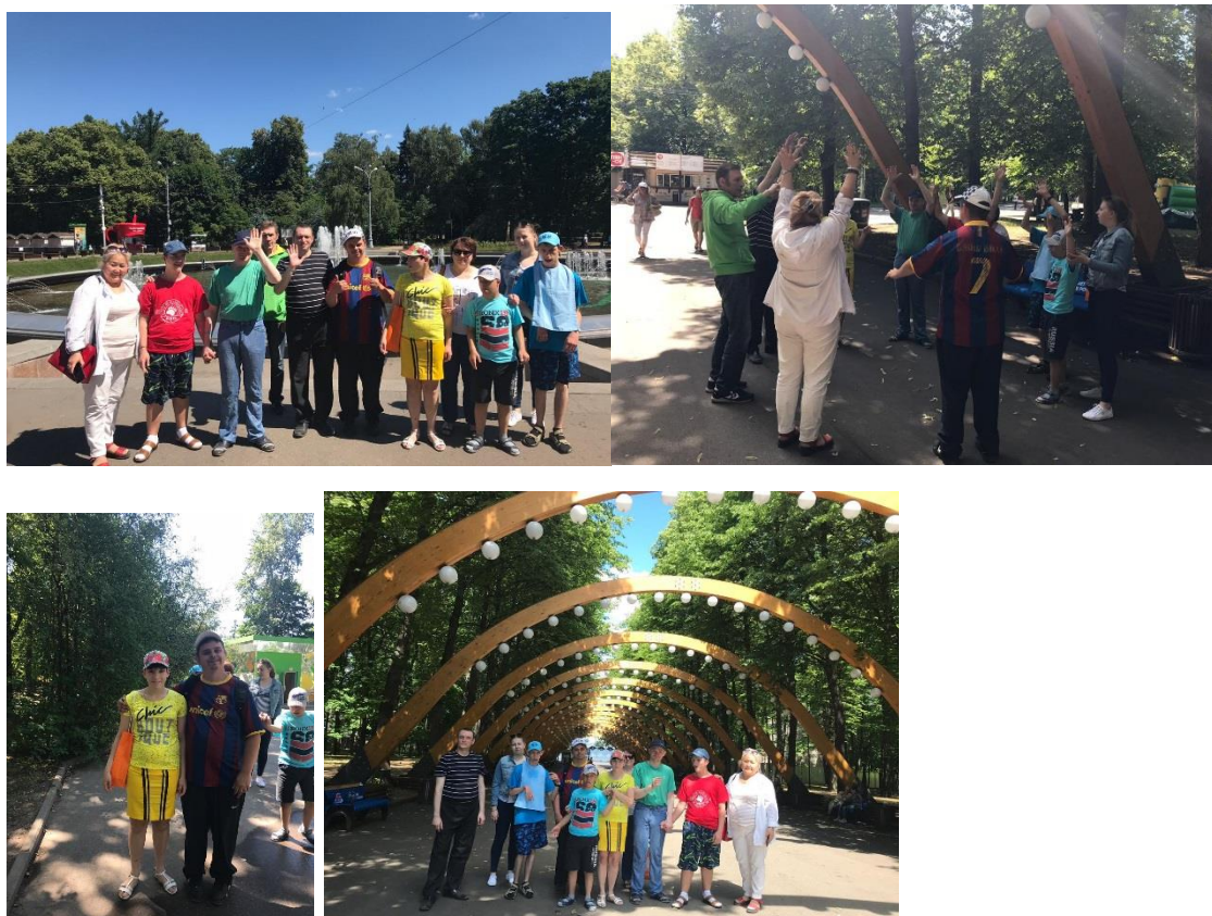
Рис. 10 Совместная прогулка выпускников и взрослых товарищей в Царицыно

9 июля взрослые участники проекта «Мягкий переход» побывали в гостях в АптСтудии 2.0. Попив чаю и пообщавшись все, дружной компанией, отправились в Парк Царицыно, где их ждала экскурсия по парку на паровозиках.