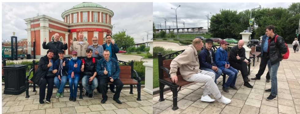
Рис. 6 Совместная прогулка выпускников и взрослых товарищей в Царицыно

24 мая 2019 г. состоялась наша первая совместная прогулка участников проекта «Мягкий переход», выбран был парк Царицыно, у входа в который, ребята и взрослые встретились.