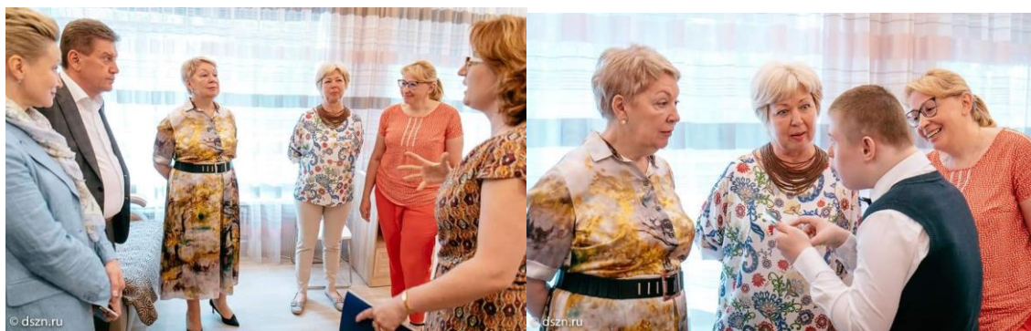
Рис. 7 Визит Министра просвещения. Презентация проекта.

30 мая, пока высокие гости знакомилась с проектом «Мягкий переход» сами ребята отправились на прогулку в парк Сокольники, Полина Б. уже нашла там взрослого друга.