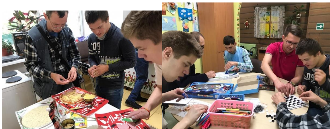
Рис. 13. Приготовление пиццы и настольные игры в ПНИ 23

В следующий раз ребята из ЦССВ приехали 13 сентября, чтобы совместно сделать пиццу, ингредиенты участники обсудили заранее. Все визуальные инструкции по изготовлению вафель остались вместе с мультипекарем в ПНИ 22, в функциональной зоне.