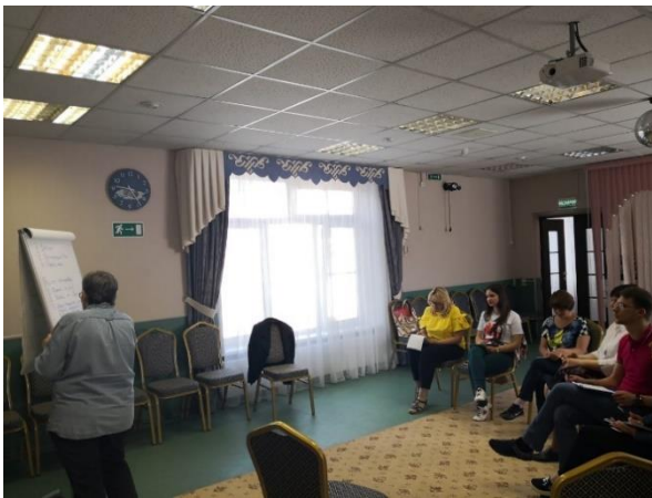
рис. 4. 20 мая 2019 г. страт-сессия перед открытием АдаптСтудии 2.0