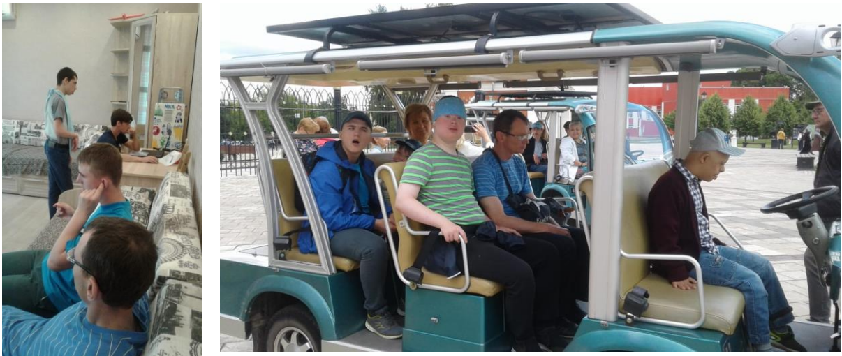
Рис.10. Взрослые товарищи в гостях у выпускников

Июль завершился для нас концертом классической музыки в Евангелическо-лютеранском соборе святых Петра и Павла, что на Китай-городе. Билеты на концерт 27 июля участникам проекта предоставил Фонд Бельканто.