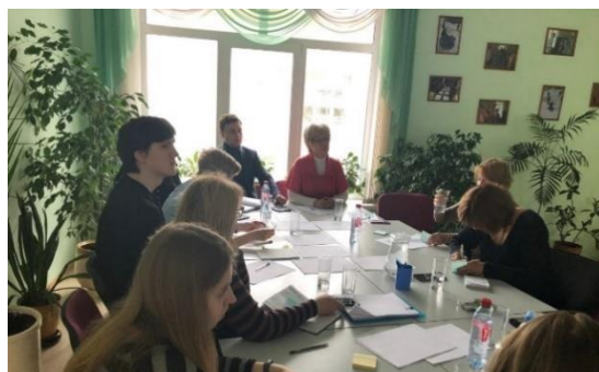
Рис. 2. Страт сессия с участием директоров ЦССВ Вера. Надежда. Любовь» и ПНИ 23