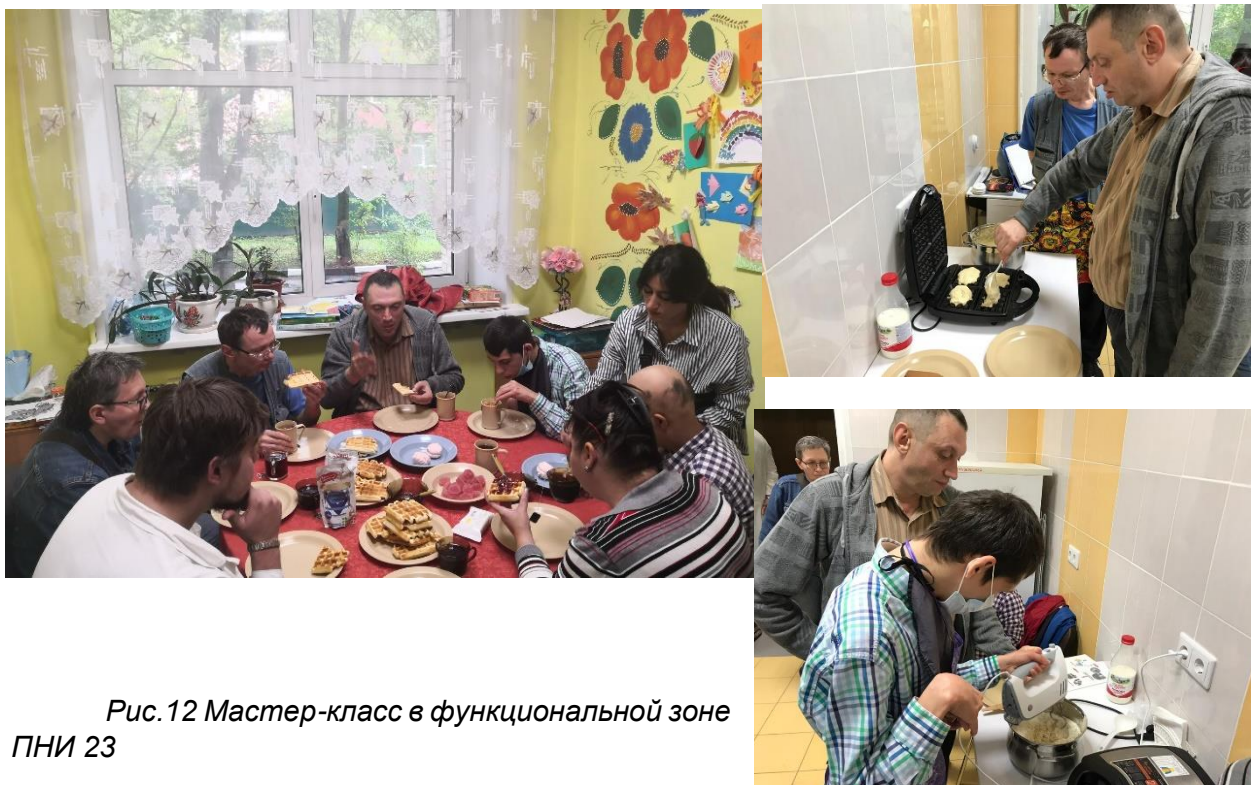
Рис. 12 Мастер-класс в функциональной зоне ПНИ 23

В следующий раз ребята из ЦССВ приехали 13 сентября, чтобы совместно сделать пиццу, ингредиенты участники обсудили заранее. Все визуальные инструкции по изготовлению вафель остались вместе с мультипекарем в ПНИ 22, в функциональной зоне.