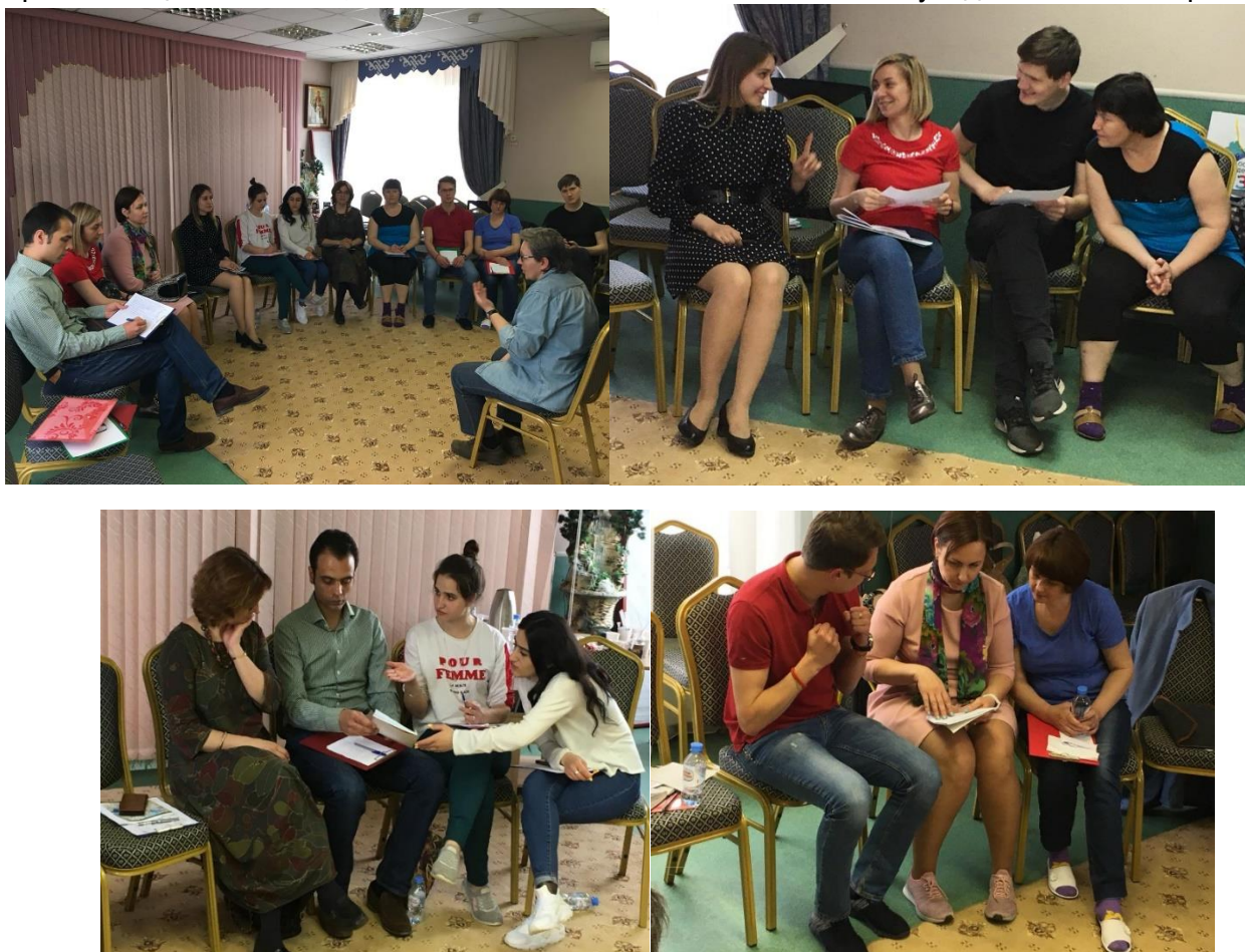
Рис. 3. Тренинги и обучение

проживающими. Вот, как это было можно увидеть на рис.3