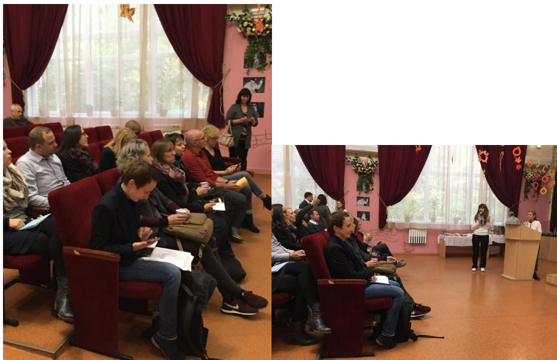
Рис. 17. Круглый стол. Обмен опытом с коллегами из Германии.

В декабре и январе в рамках проекта «Мягкий переход» прошло несколько совместных мероприятий с ПНИ23 – встреча директоров, посещение Директором ПНИ 23 учебно-тренировочной квартиры АдаптСтудия 2.0, а также кулинарные мастер-классы «Равный равному» для выпускников и проживающих ПНИ, которые были организованы как на территории Центра, так и на территории ПНИ 23. Цель взаимодействия – это подготовка группы молодых взрослых из ПНИ 23 для перехода в учебно-тренировочное общежитие Центра «Вера. Надежда. Любовь».