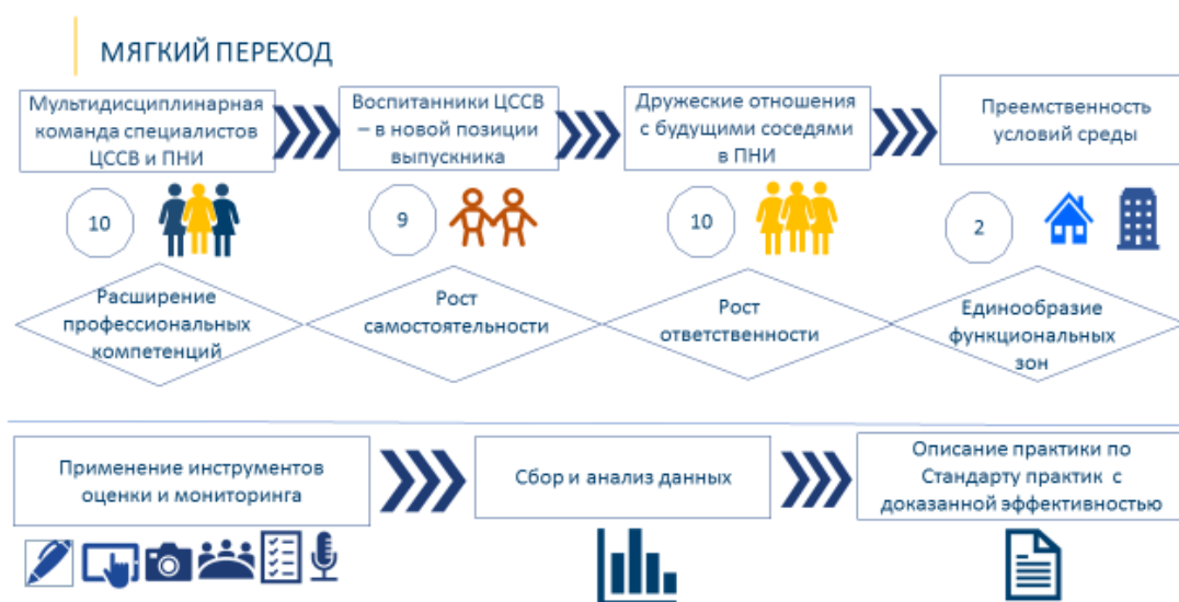
Рис.1 Дизайн проекта «Мягкий переход»

Проект «Мягкий переход» направлен на апробацию программы подготовки детей с выраженными интеллектуальными нарушениями к жизнеустройству после выхода из детского учреждения (на примере перехода из ЦССВ в ПНИ). Схематично дизайн проекта представлен на рис.1.