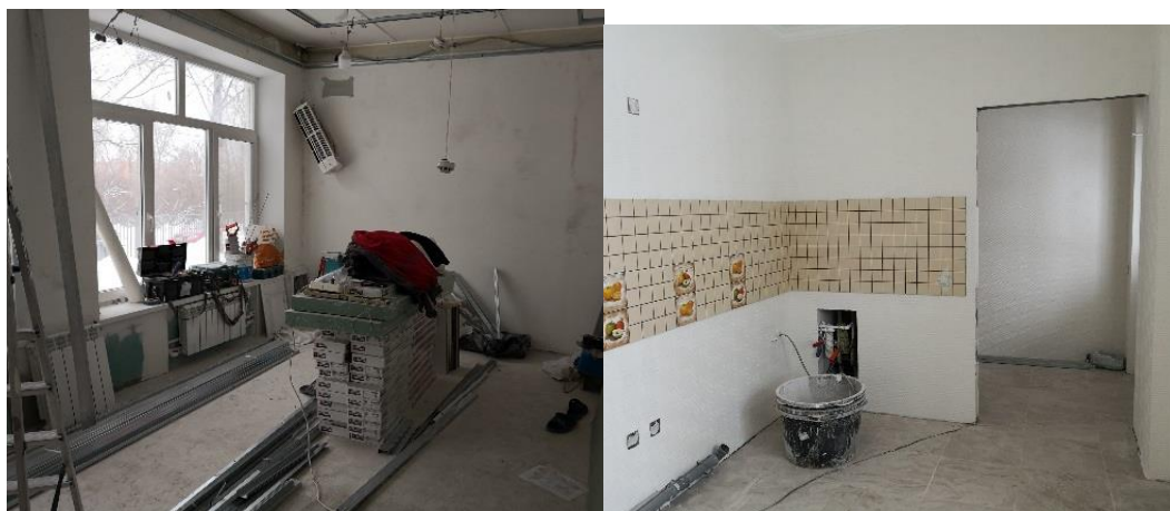
Рис.1 Начало ремонта

До проектный этап – январь-апрель 2019 года. На базе ЦССВ «Вера. Надежда. Любовь» совместно с Благотворительным фондом поддержки детей с особенностями развития «Я есть!» оборудована учебно-тренировочная квартира - АдаптСтудия 2.0, с отдельным входом, имеющая помещение для проживания, кухню, прихожую, санузел. Рис.1