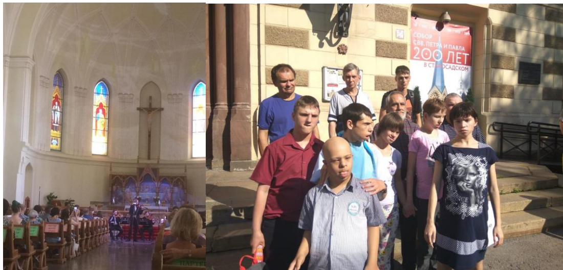
Рис.11. Совместное посещение концерта

Июль завершился для нас концертом классической музыки в Евангелическо-лютеранском соборе святых Петра и Павла, что на Китай-городе. Билеты на концерт 27 июля участникам проекта предоставил Фонд Бельканто.