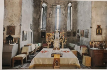
Алтарь Спасского собора

Преподобный Андрей Рублев, инок Спасо-Андроников монастыря, расписал белокаменный собор. К сожалению, от этих росписей сохранились лишь фрагменты на двух откосах окон алтаря собора - южном и северном. Эта живопись представляет собой стилизованный орнамент, помещенный в одинаковых по размеру кругах, соединенных между собой. В центре