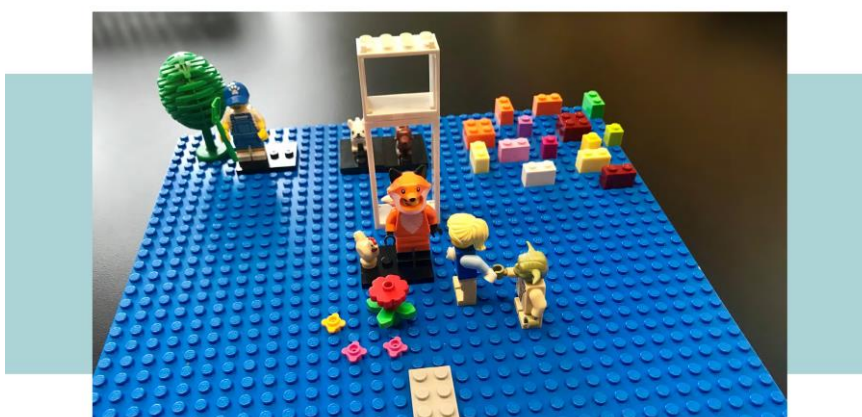
Видение эксперимента «Ресетти» командой разработчиков во время мозгового штурма в Экспериментальном центре

Сотрудники Экспериментального центра стремятся всеми силами содействовать развитию обучения и преподавания путем реализации систематических экспериментов и совместной работы на всех уровнях образования. Расширение сотрудничества и взаимодействия вне школы в будущем станет еще более важным и необходимым для обеспечения качественного образования и благополучия детей и подростков.