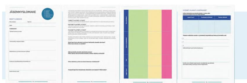
Бланк для структурирования «Ресетти»

«Ресетти» предполагает совместное структурирование в ходе обычной повседневной работы, для чего внимательно собирают наблюдения разных участников ситуаций. В качестве вспомогательных инструментов можно использовать дневник, фотографии, рисунки и уже готовые бланки. Вместе с участвовавшими в работе детьми и родителями разработан Бланк для структурирования «Ресетти», который можно использовать для сбора наблюдений. В конце пособия представлен бланк целиком.