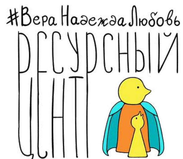
Ресурсный центр «Вера. Надежда. Любовь»